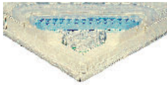
Diamona 500 Euro

Kuhlen. Die harte Matratze wies nach der Dauerprüfung Härtever-lust mit einer spürbaren Kuhlenbil-dung auf. Stützt Seitenschläfer schlechter ab als Rückenschläfer.