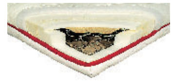
Annette Rummel 249 Euro

Preiswert. Relativ leichte Matratze mit befriedigenden Liegeeigen-schaften. Sehr guter Bezug. Unangenehmer Geruch noch einen Tag nach dem Auspacken.