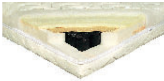
Panther 299 Euro