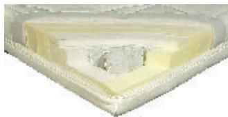
Malie 7-Zonen 170 Euro