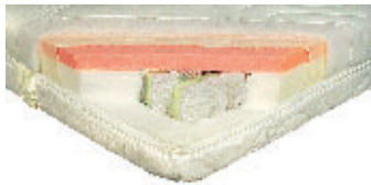
Breckle 225 Euro

Mittelhart. Relativ leichte, mittel-harte Matratze. Sie stützt die Seitenschläfer schlechter ab als die Rückenschläfer.