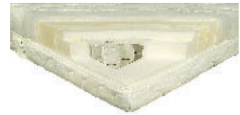
Badenia 249 Euro

Sehr weich und teuer. Matratze mit befriedigenden Liegeeigen-schaften. Weicher als angegeben, sehr weich statt soft-mittelfest.