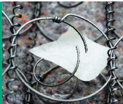
Taschenfederkern: Stahlfedern in Stofftaschen mit Schaumstoffelementen (rechts außen).