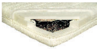
Winkle 119 Euro

Riecht stark und ist teuer. Teure Matratze mit befriedigenden Liegeeigenschaften. Anfangs star-ker, länger anhaltender Geruch.