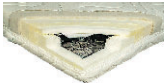
f.a.n. 229 Euro