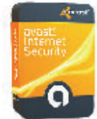
6 Avast! Internet Security, 45 Euro

Sehr schnell. Scant sehr schnell und verlangsamt den Rechner kaum. Bester Wächter, Scanner befriedigend. Die Firewall ist gegen Angriffe von außen durchlässiger als die von Windows 7. Handhabung durchweg gut.